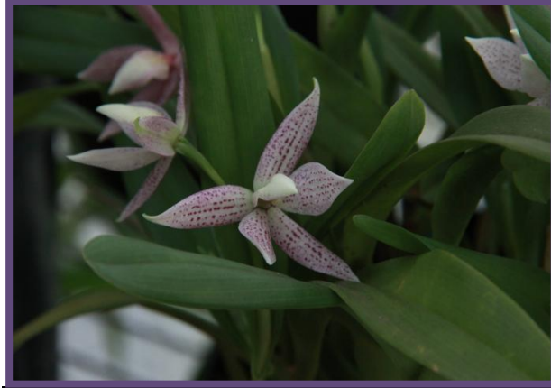
Prosthechea garciana

Le genre Prosthechea est un genre qui regroupe une partie des orchidées répertoriées avant 1997 dans le genre Encyclia . Ce sont les travaux réalisés sur l'ADN des orchidées par W.E. Higgins qui ont permis de différencier ce genre. Il n'est donc pas rare de trouver ces orchidées dans le commerce sous la dénomination Encyclia .