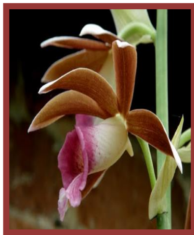
Phaius tankervillaea appartenant à et photographié par B. Lerot

Le genre Phaius , allié de celui des Calanthe , compte une quarantaine d'espèces. Il fut établi par J. de Loureiro en 1790. Le nom vient du grec « phaios » = « brun, sombre » en référence à la couleur des fleurs, e.a. lorsqu'elles fanent.